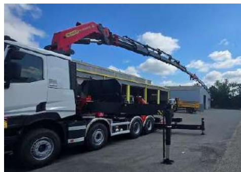
Photo illustrative - grue de grande capacité en déploiement